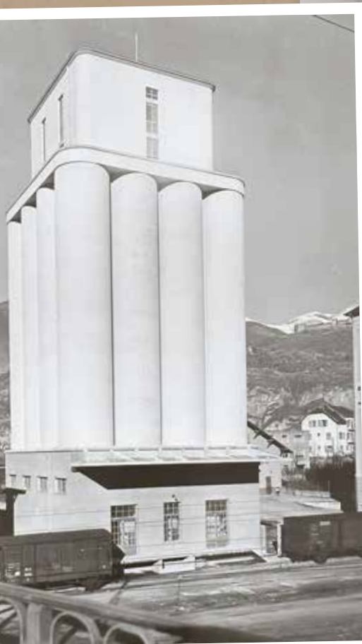
Le silo à blé de Plainpalais en 1935