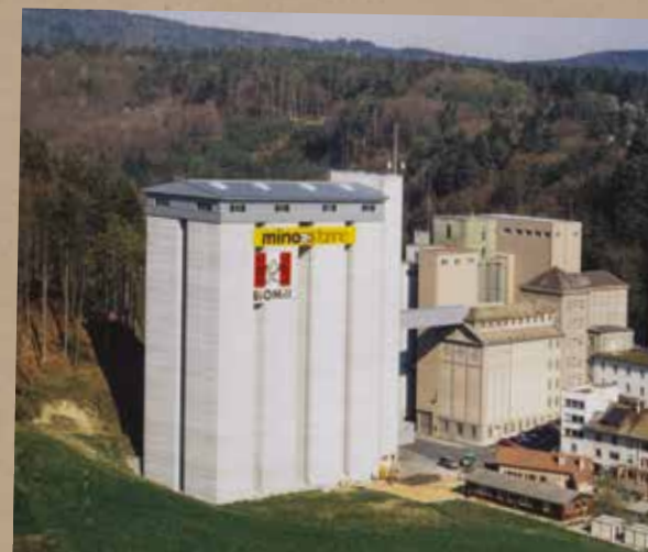
Le silo à blé de Sion en 1935